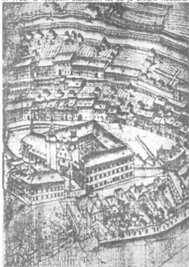
Slika 1. Ljubljanski jezuitski kolegij z okolico (okrog 1660)

Bernhard Ferdinand Erberg (1718-1773) je bil profesor matematike in filozofije na liceju v Ljubljani med leti 1751 in 1758. Iz njegovih študijskih let se je ohranil nedatiran