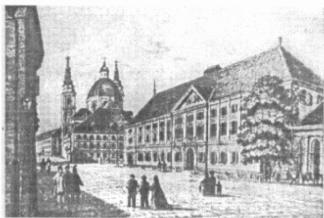
Slika 3. Licejsko poslopje v Ljubljani (zgradbo, ki je stala na Vodnikovem trgu (tržnica), so po potresu porušili). V njem sta bili še gimnazija in normalka.