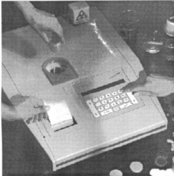
RENTGENSKA FLUORESCENTCA TIP LAB-X 3000 ZA KONTROLO KVALITETE (UPORABLJA RENTGENSKO CEV IN NIČ VEČ IZOTOPOVI)

SMO ZASTOPNIK IN EKSKLUZIVNI DISTRIBUTER ZA OXFORD INSTRUMENTS MAG IN AIR LIQUIDE CRYOGENIE.