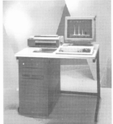
EDS - ENERGIJSKO DISPERZIVNI SISTEM TIP EXL II