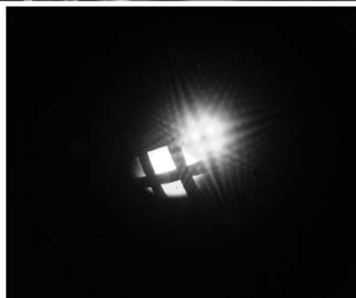
Slika 4: Nekateri nanostrukturirani materiali so pogosto že ob sintezi urejeni v obliki nanocevk in nanožic, ki se končajo kot atomsko ostre konice. Le-te omogočajo hladno emisijo elektronov v zmerno močnem električnem polju, kar lahko uporabimo v vrsti elektronsko optičnih naprav. Na zgornji sliki je vakuumska diodna celica za meritev in opazovanje kotne porazdelitve emitiranega toka (naredili so jo v Odseku za tehnologijo površin in optoelektroniko na Insitutu "Jožef Stefan" v sodelovanju s podjetjem LPKF), ki izhaja iz anorganskih nanocevk, sintetiziranih na IJS. Na spodnji sliki je vzorec elektronov, ki izhaja iz osamljene nanocevk. Med njo in zaslonom je nameščena fina kovinska mrežica. Strukturo dodatne slike povzročijo sipani in odbiti sekundarni elektroni, ki izhajajo iz mrežice.