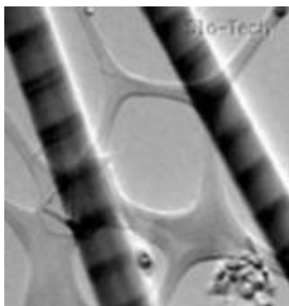
Slika 1: Nanožičke med živčnimi celicami

predstavili, pa je bila zelo široka – od nanomaterialov, kvazikristalov, elastomerov do tehnologij za obdelavo in karakterizacijo površin sodobnih materialov, elektronske, inženirske in biokeramike, nanostrukturnih prevlek in procesiranja keramike, intermetalnih zlitin, magnetnih materialov, tankih plasti in nanožičk.